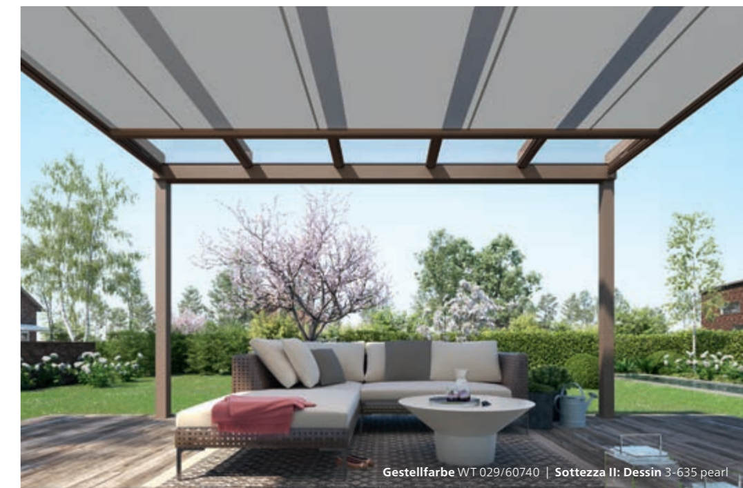
Gestellfarbe WT 029/60740 | Sottezza II: Dessin 3-635 pearl

Ein angenehmes Klima auf Ihrer Terrasse verspricht die Wintergarten-Markise Sottezza II . Der dekorative Sonnenschutz ist formschön, schlank, zurückhaltend – und pflegeleicht. Denn Sottezza II ist unter dem Terrassendach angebracht. Das schützt sie vor Feuchtigkeit und Schmutz, das Tuch bleibt attraktiv und sauber.