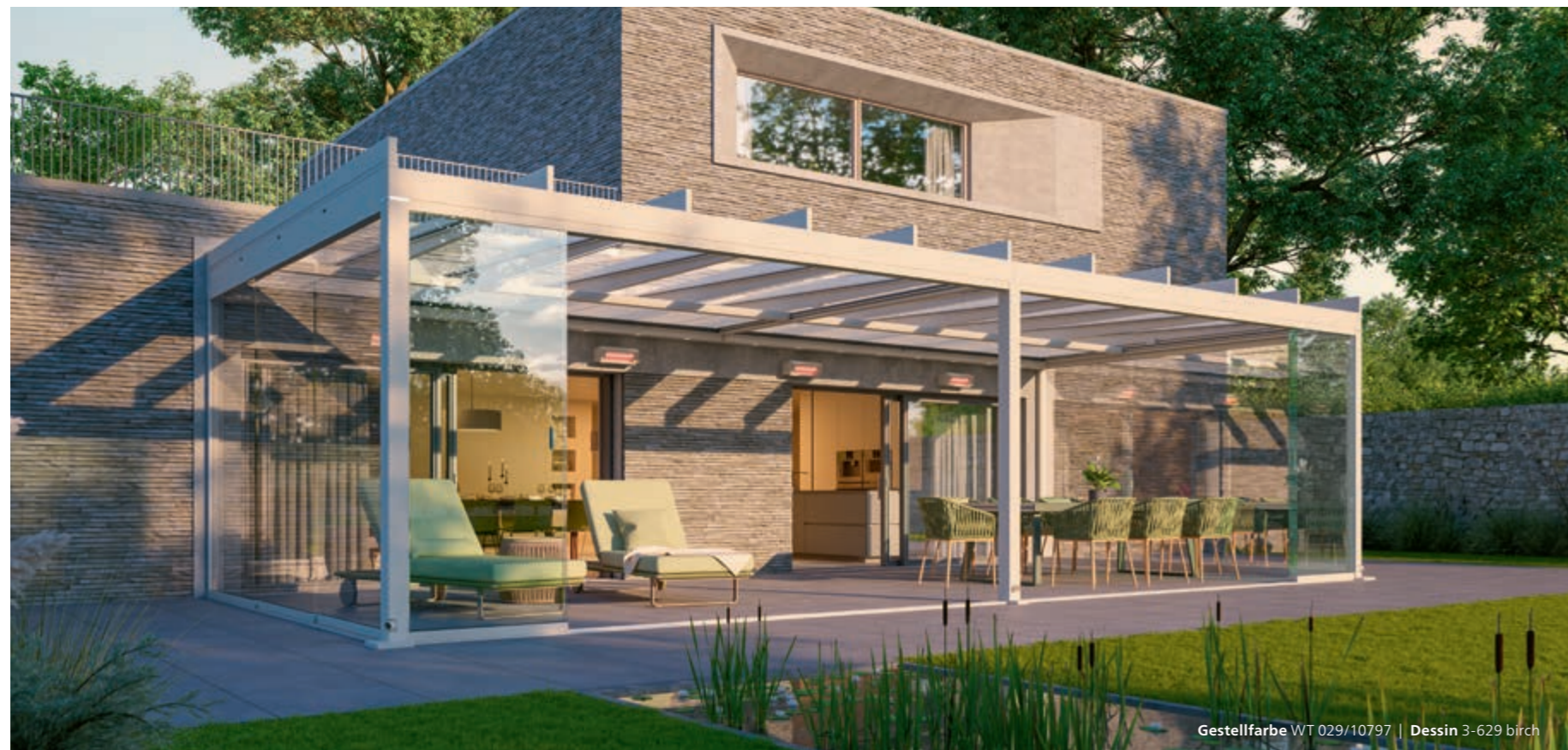
Gestellfarbe WT 029/10797 | Dessin 3-629 birch

Größe des abgebildeten Terrassendachs: 9,5 x 3,5 m