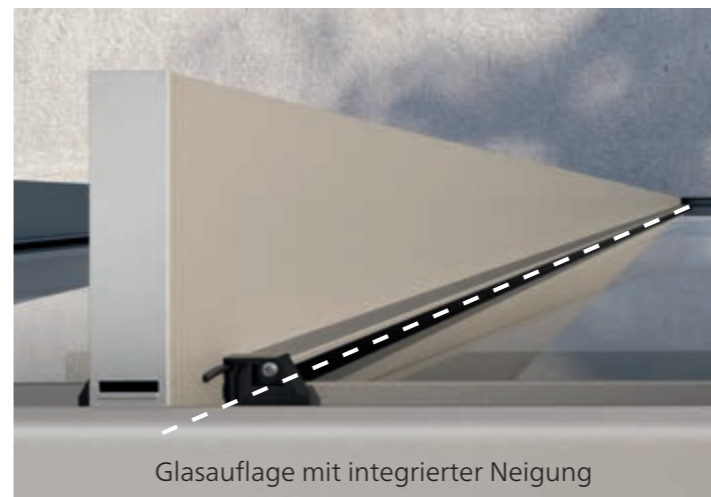
Glasauflage mit integrierter Neigung