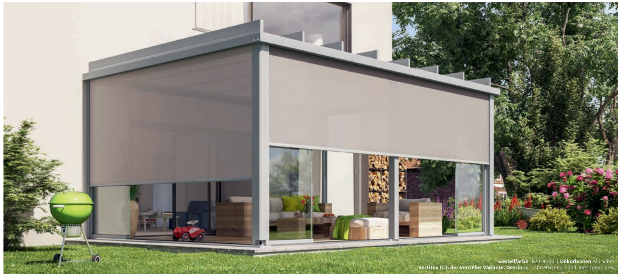
Gestellfarbe RAL 9006 | Dekorleisten Alu Silber VertiTex II in der VertiPlus Variante: Dessin GI asfaserscreen 7-204 linen | pearl grey

Sie möchten von den Seiten und von vorne vor Blicken und blendendem Licht geschützt sein? Dann ist die Senkrecht-Markise VertiTex II von weinor die richtige Wahl. Die speziell für VertiTex II entwickelte Kollektion screens by weinor® umfasst eine große Auswahl an hochwertigen Tüchern. Und das patentierte weinor Opti-Flow-System® gewährleistet einen optimalen Tuchstand. VertiTex II für Terrazza Pure gibt es auch in der optisch attraktiven VertiPlus Variante mit Design-Blenden.